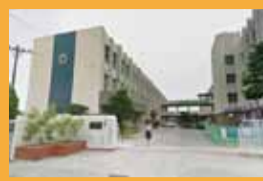
「香西小学校」 徒歩15分

駅や国道11号線へも快適アクセスで 周辺に文教施設 商業施設が点在する好立地！ 家族にやさしい新生活の拠点です。