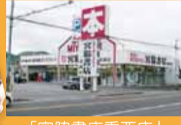
「宮脇書店香西店」 徒歩5分