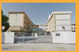
「勝賀中学校」 徒歩10分