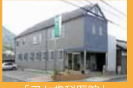
「アヤ歯科医院」 徒歩5分