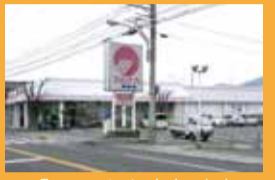
「マルナカ鬼無店」 徒歩5分